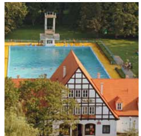
W 2011 r. planowana jest przebudowa kompleksu basenowo-hotelowego przy ul. Świętokrzyskiej.