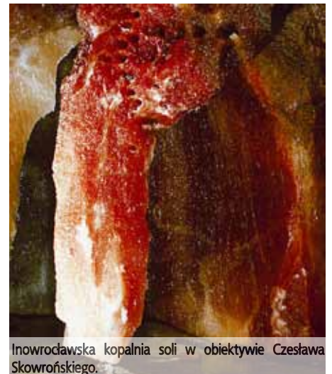
Inowrocławska kopalnia soli w obiektywie Czesława Skowrońskiego.