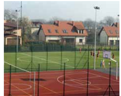
Jeden z kilku inowrocławskich „Orlików” (SP nr 11). W 2011 r. kolejny powstanie przy Gimnazjum nr 2.