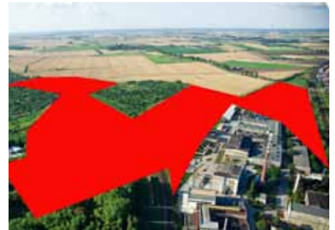
III strefa (oznaczona na czerwono) Inowrocławskiego Obszaru Gospodarczego.