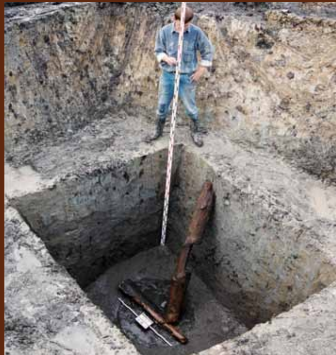
Studnie, wydrążone do głębokości 3–4,5 m, były wąskie, ze ścianami obudowanymi drewnianą plecionką z prętów i żerdzi na podobieństwo kosza. W jednej z nich zachowały się części drabiny z pnia sosny.